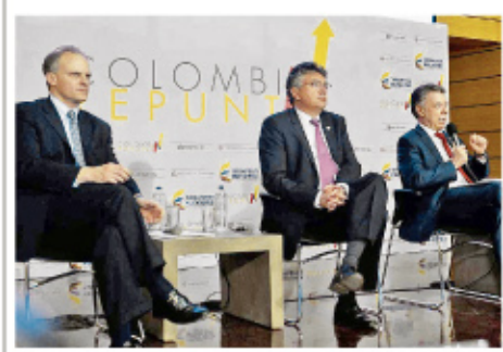
Alejandro Werner, director del FMI para el hemisferio; el minhacienda, Mauricio Cárdenas, y el presidente Juan Manuel Santos, hablaron sobre la expectativa económica del 2017.

ECONOMÍA PÁG.14 El plan de repunte económico vale $40,3 billones.