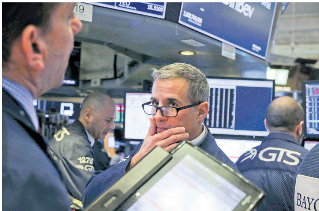
La pelea entre Washington y Pekín se sintió en Wall Street, porque Apple vendería menos iPhones.

Una resolución del Dane subió hasta en 100%, en algunos casos, el valor de referencia de las bebidas alcohólicas para tributar en 2019. Piden frenar la norma. Pág. 6