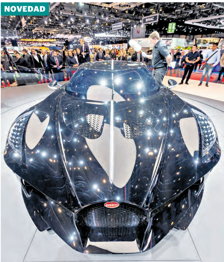
El lanzamiento se hizo en el Salón Internacional del Motor de Ginebra (Suiza).