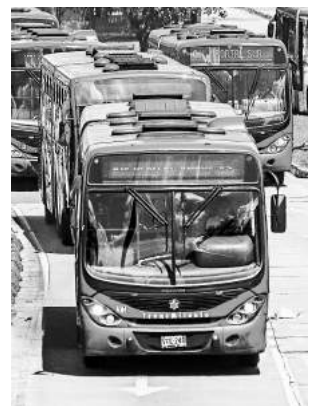
Estas obras demandan inversiones por más de $5 billones.