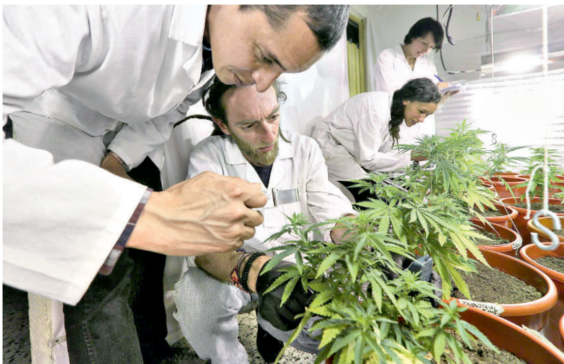
En el 2020 el país tendría más sustento para justificar la asignación de una producción mayor.

El Consejo Gremial, Anif, Fasecolda y analistas han expresado su desacuerdo con gran parte de los artículos de esta iniciativa, presentada por el contralor general, Carlos Felipe Córdoba, y que ya fue aprobada en seis de ocho debates. Pág. 8