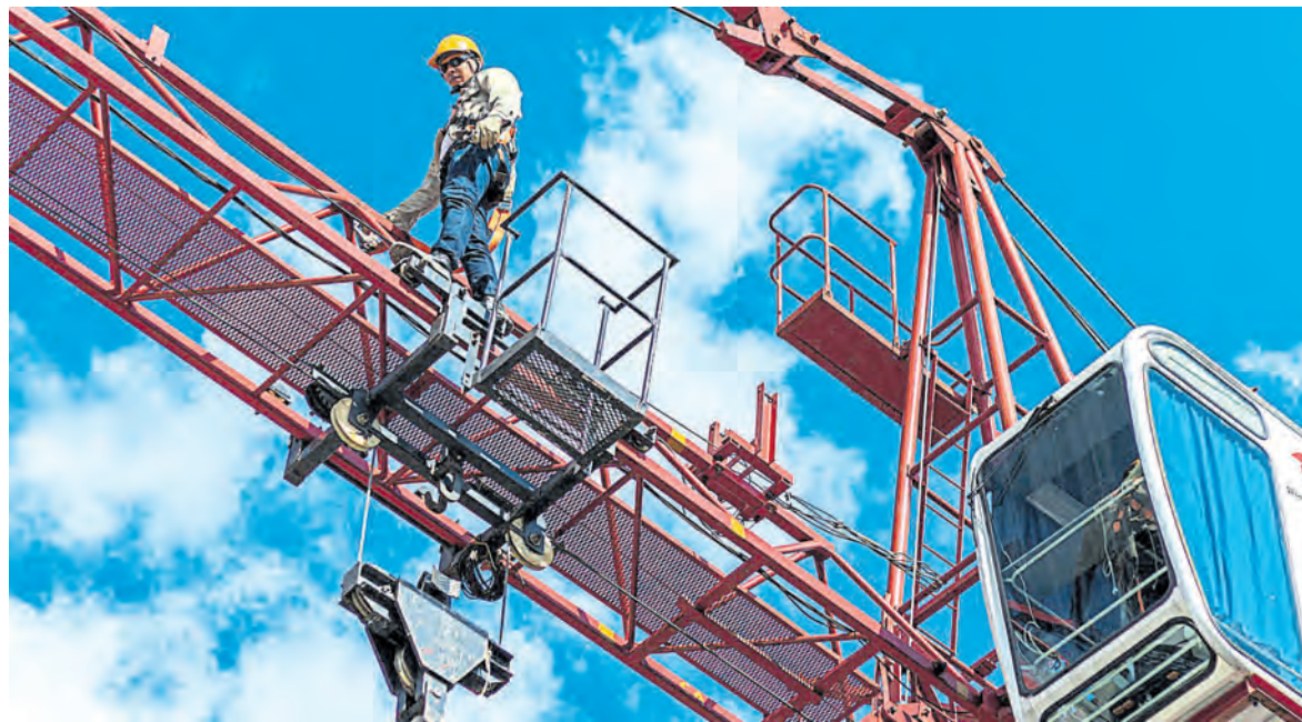
Los sectores de servicios públicos y transporte urbano podrían aprovechar cambios tecnológicos.

Según un informe de CAF, que se publica hoy, América Latina enfrenta importantes retos en regulación, inversión y políticas públicas para avanzar en esta tarea pendiente y mejorar en servicios. Pág. 8