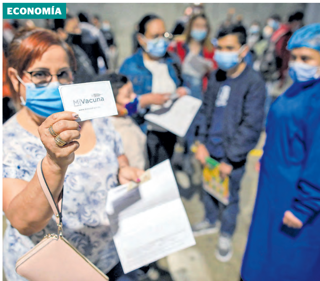
Las empresas sí destacan la necesidad de seguir impulsando la inmunización en la población. CEET

Subió 18,8% frente a 2020, con $9,66 billones adicionales en relación al año previo. Renta, impuesto a las ventas y aduanas, los gravámenes que más aportaron. Pág. 6